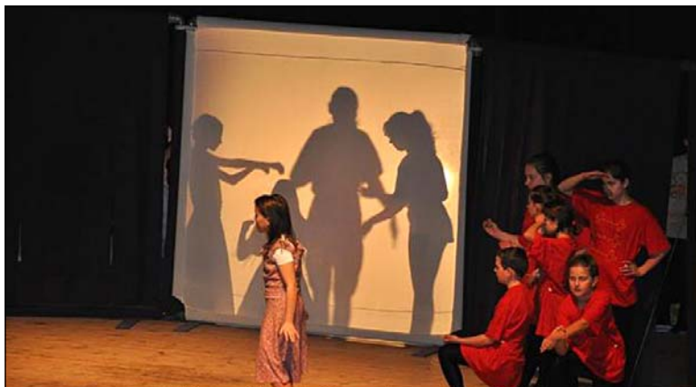
Záber z divadelného predstavenia Luskáčik (O erb mesta Dolný Kubín – Dolný Kubín 2010)