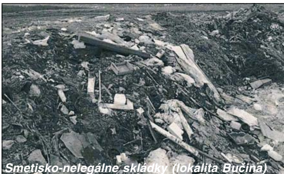
Smetisko-nelegálne skládky (lokalita Bučina)