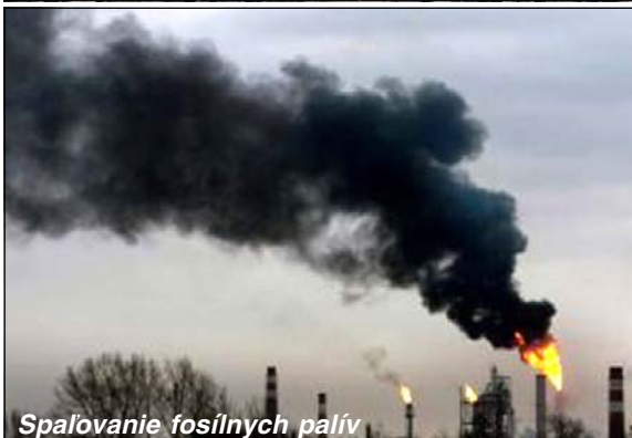
Spalovanie fosílnych palív