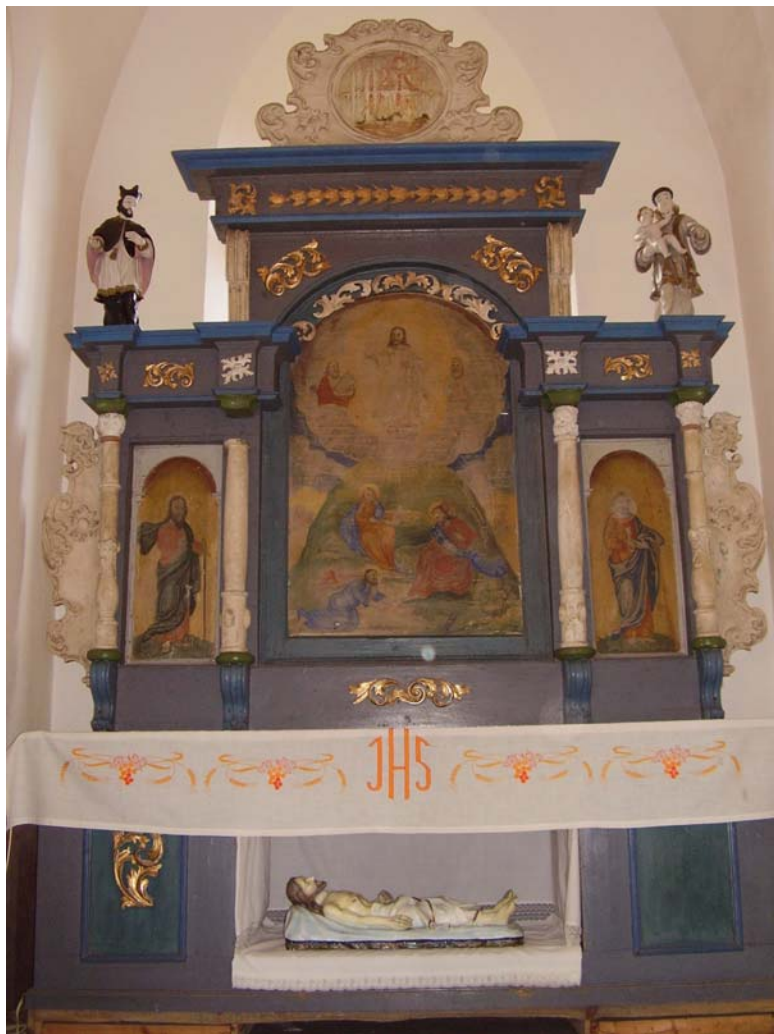
Oltár premenenia pána z polovice 17. storočia

Direktor Oravského komposesorátu a zároveň oravský župan Štefan Tekeli sa vraj pripojil k sprisahaniu uhorských veľmožov proti cisárovi, vedených uhorským palatínom Františkom Vešelénim. Po smrti Františka Vešeléniho stál na čele sprisahania Peter Zrínsky. Sprisahanie bolo v roku 1671 prezradené a cisár Leopold Habsburský dal ob-