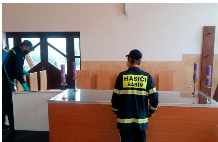
Dobrovolní hasiči pri dezinfekcii verejných priestorov