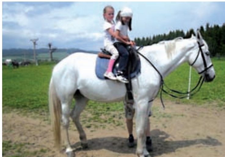
Jazdenie na koníkoch na Edyho ranči.

a na Edyho ranč a prijemniť tak svojim ratolestiam ich sviatok. Sniečko nás sprevádzalo i cestou pomedzi les vláčikom – motoráčikom. Deti sa nadýchali čerstvého horského vzduchu, z rozhladne si pozreli krásu oravskej prírody a vrátili sa späť na stanicu Ta-