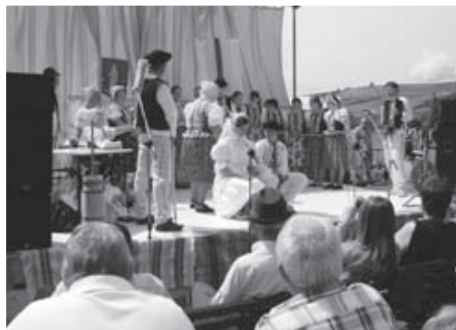
Vystúpenie Folklornej skupiny z Babína počas Dňa obce 2010.