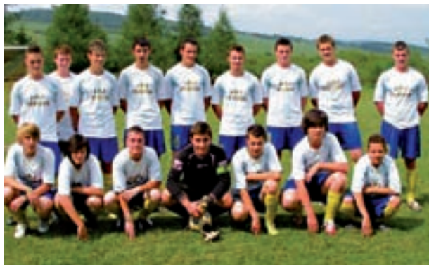
Dorastenci v jarnej časti futbalovej súťaže vyhrali všetky svoje zápasy a postúpili do I. triedy.