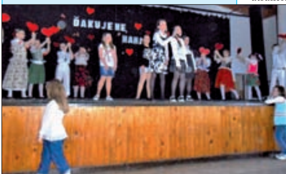
Piesne, básne a hry venovali svojim mamičkám k ich Dňu babínske deti.