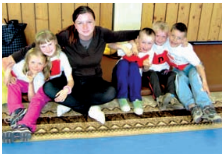
Malí športovci počas športovej olympiády na Deň detí si užili veľa radosti.

nečník, kde na ne už čakal autobus, ktorým sa odviezli na Edyho ranč. Povožili sa na koníkoch, vyšantili na preliezkach a zaplnili prázdne brušká chutným obedom. Prijemne unavení a plní zážitkov sme sa vrátili domov. Cestou späť sa au-