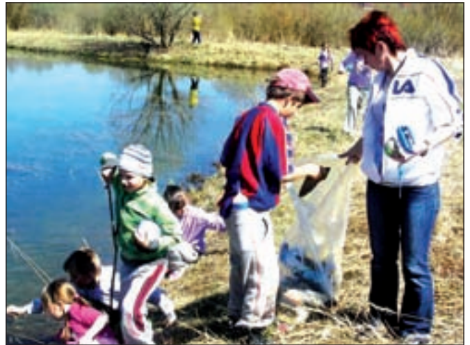
V rámci akcie Vyčistíme si Slovensko sa aj babínske deti zapojili do čistenia časti obce a jej okolia. Určite si želáme, aby nám to v tomto stave dlho vydržalo.

Prvý júnový deň patril tradične našim deťom, pre ktorých sme v spolupráci so ZRŠ a obecným úradom, za podpory starostu, pripravili bohatý program v areáli školy. O zábavu a občerstvenie sa posta-