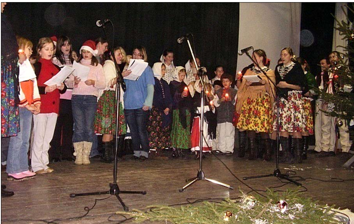
Dňa 20. decembra sa v MKS Babín konali IV. Betlehemske vianoce. (viac na str.5)